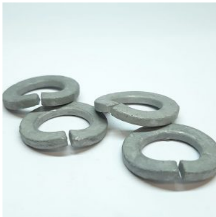
DIN 128 Podložka pružná