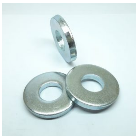
DIN 7349 Podložka kruhová