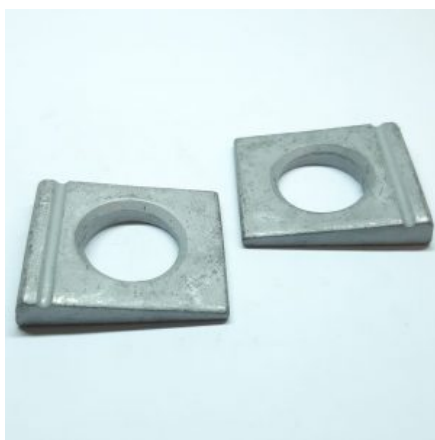
DIN 6917 Klinová podložka pod U profil