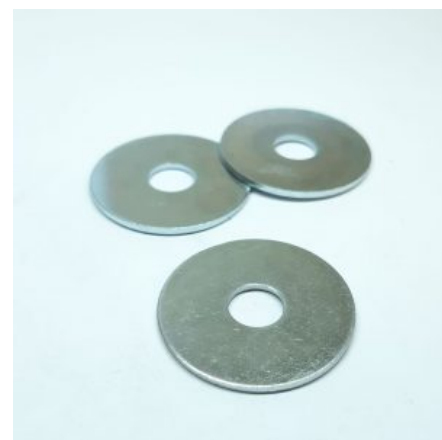
DIN 901 Karosárska podložka