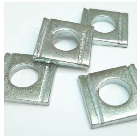
DIN 434 Podložka štvorhranná pre nosíky U